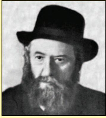
Раввин Шалом Довбер